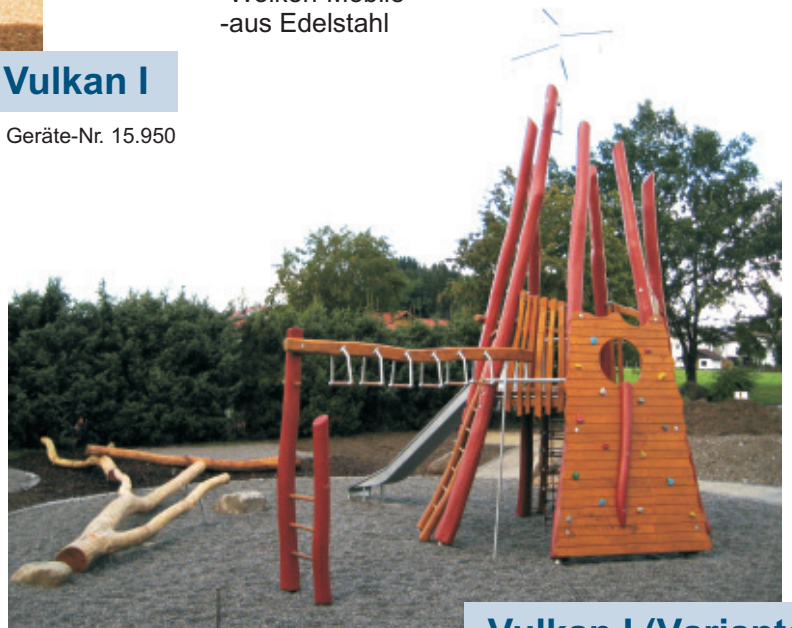
Vulkan I (Variante)