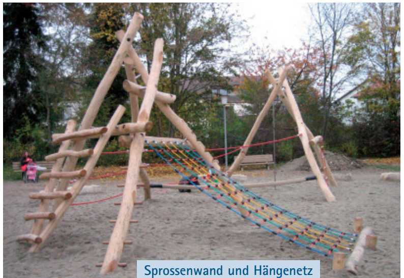
Sprossenwand und Hängernetz