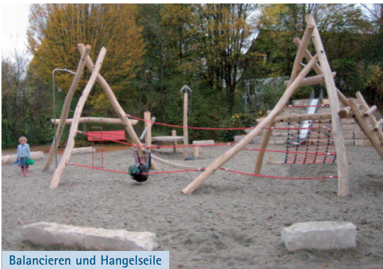
Balancieren und Hangelseile